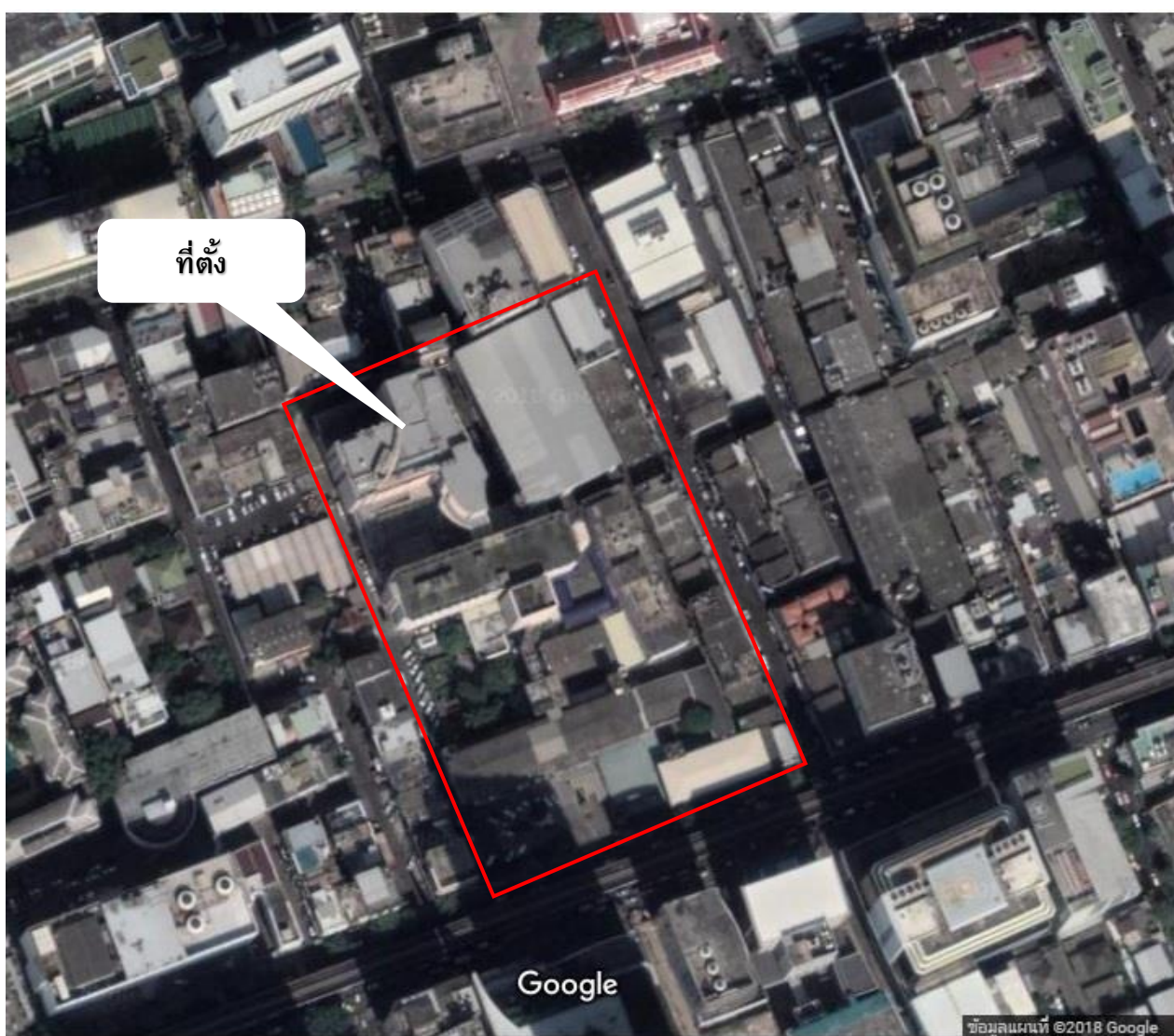
รูปภาพ 1-1 แผนที่โครงการ

8.3 ที่ตั้งโครงการ โรงพยาบาลกรุงเทพคริสเตียน ตั้งอยู่เลขที่ 124 ถนนสีลม แขวงสุริยวงค์ เขตบางรัก จังหวัดกรุงเทพมหานคร ก่อสร้างเมื่อปี พ.ศ.2478 จนถึงปัจจุบัน มีจำนวนเตียงผู้ป่วยค้างคืนทั้งหมด 244 เตียง ดังแสดงในรูปภาพ 1-1